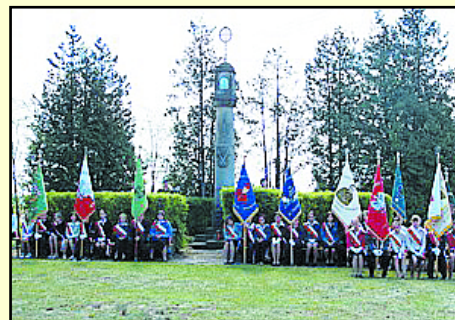
Foto: Pomnik w Nagoszewie