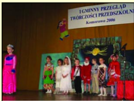
Foto: Prezentacja maluchów z Przedszkola Samorządowego w Komorowie

Na sali widowiskowej Klubu Garnizonowego w Komorowie, maluchy z oddziałów przedszkolnych z terenu Gminy Ostrów Mazowiecka (Ugniewa, Jelonek, Nowej Osuchowej, Kozik, Dud, Kalinowa, Lubiejewa, oraz gospodarzy Przedszkola Samorządowego w Komorowie) prezentowały swoje umiejętności wokalne, recytatorskie oraz taneczne. Ogółem zaprezentowało się 119 dzieci. Dla większości z nich było to ogromne przeżycie, gdyż to nie to samo co występ w swojej szkole. Tutaj zmierzyły się ze sceną, światłami, mikrofonem i licznie przybyłą publicznością. Występy wszystkich uczestników były wspaniałe pomimo tych pierwszych kroków scenicznych. Wnosiły uśmiech na twarze obserwatorów i gromkie brawa uznania.