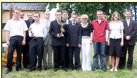
Foto: Zwycięzcy VI Gminnej Gimnazjady

Dzieci i Młodzieży. Wśród Szkół Podstawowych zwyciężyła szkoła z Dybek, a kolejne miejsca zajęli młodzi sportowcy z Komorowa, Kalinowa, Jelonek, Nagoszewki, Jasienicy, Ugniewa, Lubiejewa, Dud, Nagoszewa, Kozik, Nowej Osuchowej. Wśród Gimnazjów tak samo jak w poprzednich dwóch latach I miejsce zajęło Gimnazjum w Jasienicy, II miejsce Gimnazjum w Jelonkach, III miejsce Gimnazjum w Nagoszewie, IV miejsce Gimnazjum w Komorowie.