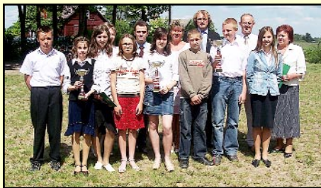
Foto: Zwycięzcy VII Gminnej Olimpiady

Drugą częścią uroczystości było podsumowanie roku sportowego w Gminie Ostrów Mazowiecka. Wręczone zostały medale w konkursie plastycznym pt. "Logo Gminnej Olimpiady", oraz puchary i dyplomy dla szkół podstawowych i gimnazjów za osiągnięte wyniki w VII Gminnej Olimpiadzie i VI Gminnej Gimnazjadzie