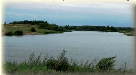
Zbiornik - Przyborowic.

słupa i często nie odwracalnym kalectwem.