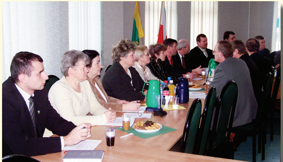
Obrady radnych podczas IV Sesji Rady Gminy

Wydatki na 2007 rok zaplanowano w wysokości 25 793 746 zł. Tradycyjnie najwięcej pieniędzy przeznaczonych zostanie na gminną oświatę, na utrzymanie 15 placówek oświatowych – 10 924 227 mln zł. Drugą bardzo istotną pozycją w budżecie gminy są zadania inwestycyjne ujęte na 2007 rok w Wieloletnim Planie Inwestycyjnym Gminy (WPI), a związane z poprawą gminnego mienia komunalnego (drogi, wodociągi i kanalizacja, szkoły), na które przeznaczono środki w kwocie ponad 4,7 mln zł tj. 18,58% całego budżetu. W budżecie na 2007 rok zaplanowano wykonanie ponad 5 km dróg w miejscowościach: Jelonki, Nowa Osuchowa ul. Szkolna, Podborze ul. Sosnowa, Ugniewo ul. Szkolna, oraz wykonanie odcinków dróg łączących miejscowości: Jelenie – Przyjmy, Rogóźnia – Popielarnia. Zaplanowano również środki na budowę 13 172 m sieci wodociągowej z 121 przyłączami w miejscowościach Pałapus, Budy Grudzie, Antoniewo, oraz na ul. Leśnej i Majdan w Ko-