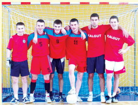
Drużyna z Kalinowa