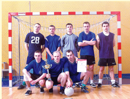
Drużyna "DREWMAX" ze Stoku