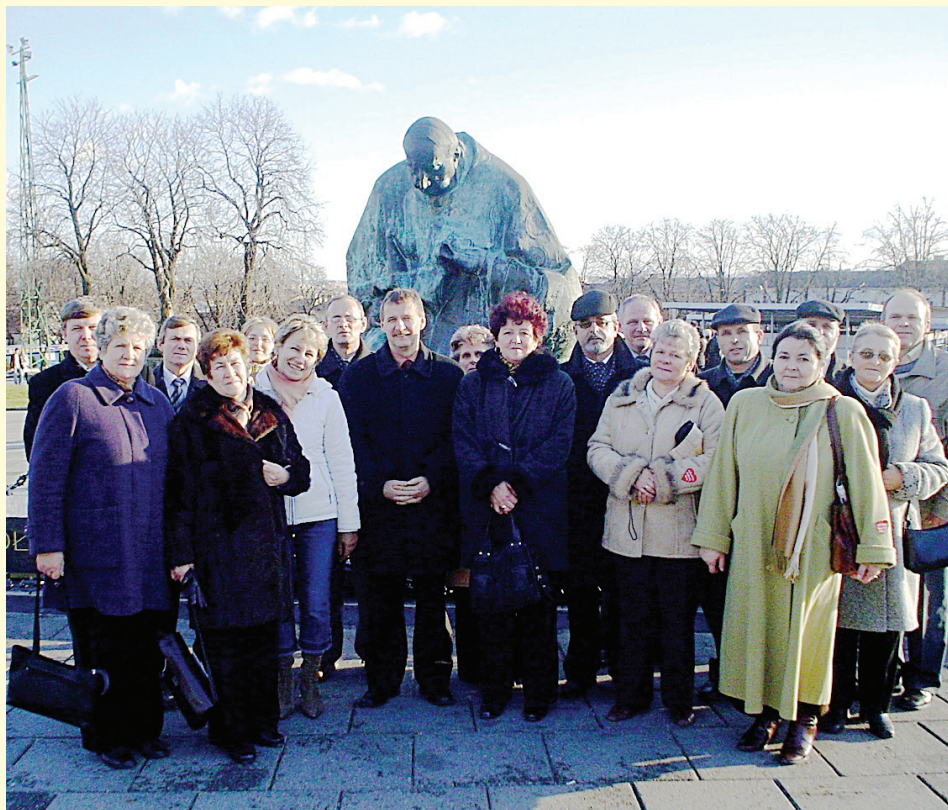
Samorządowcy z Gminy Ostrów Mazowiecka