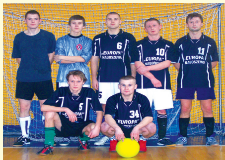
Drużyna z Nagoszewa

coraz lepiej, to sekret zwycięskiej drużyny kryje się nie tylko w dużej formie fizycznej zawodników i licznych treningach, ale przede wszystkim w umiejętności grania zespołowo, oraz przy dużym udziale swoich kibiców, którzy dopingują każdy z rozgrywanych przez nich mecz. Serdecznie gratulujemy wszystkim drużynom i zapraszamy do udziału w letnich rozgrywkach. □