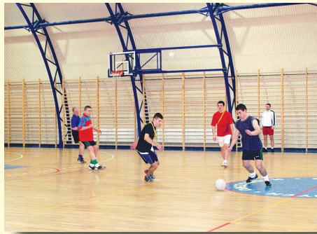
Na zdj. mecz „Drewmax” Stok - Nowa Osuchowa zakończony wynikiem (15 : 1)

Drużyna „Drewmax” ze Stoku jest już trzykrotnym Mistrzem Gminy Ostrów Mazowiecka w piłce nożnej halowe. Choć wiele drużyn gra z roku na rok