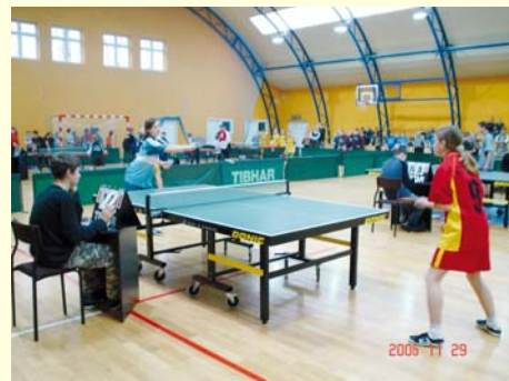
Turniej Tenisa Stołowego