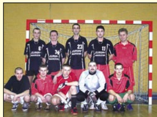
drużyna z Nagoszewa

Na zdj. drużyny, które awansowały do rundy finałowej.