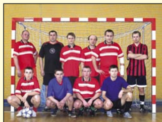
drużyna z Ugniewa