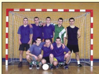
drużyna „Drewmax” ze Stoku

Drewmax Stok 6 pkt. bramki (19 – 2) Ugniewo 6 pkt. bramki (6 – 0) Nagoszewo 6 pkt. bramki (10 – 7)